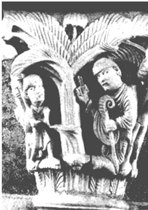
Abb. 3: Martin fällt die heilige Föhre

len. Träger des Religionssystems ist der Stamm oder der Clan. Die religiöse Gemeinschaft ist zugleich auch die soziale Gemeinschaft. Es bildet sich aber bereits eine Priesterschaft heraus und somit auch ein Unterschied zwischen Priester und Laie. Die religiösen Handlungen werden in Opfer und Gebet vollzogen, die Funktion der Religion ist vor allem die Legitimierung von politischen und sozialen Strukturen (zusammengefasst nach Piller, Fabian: Skript „Totemismus“, Ergänzungsfach Religion am Gymnasium Burgdorf 2005; Quellenangabe des Skripts: Bellah, Robert N.: Religiöse Evolution, Frankfurt 1993, S. 267-303).