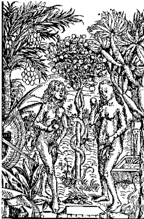
Abb. 1: Paradiesbaum

„Und Gott der Herr liess allerlei Bäume aus der Erde wachsen, lieblich anzusehen und gut zu essen, und den Baum des Lebens mitten im Garten, und den Baum der Erkenntnis des Guten und des Bösen“ (1. Mos 2,9).