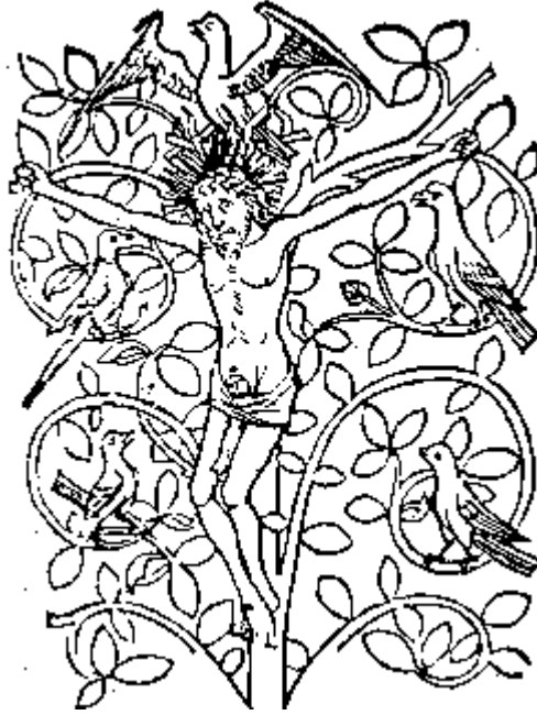
Abb. 2: Kreuzesbaum

Laut Heiler war vor allem für die mittelalterlichen Mystiker das Kreuz ein Lebens- und „Minnebaum“. 29 Er symbolisiert Gott und die göttliche Gnade. Heiler sagt dazu: „Es besteht keine bloße Zufälligkeit in der Wahl solcher Sinnbilder, sondern ein innerer Zwang. Das äussere Objekt, das Träger der Heiligkeit und Lebenskraft in der primitiven Religion war, wird in der höheren zum Sinnbild der göttlichen Kraft. Ein Einheitsband umschliesst den primitiven Realismus mit dem sublimsten Symbolismus.“ 30