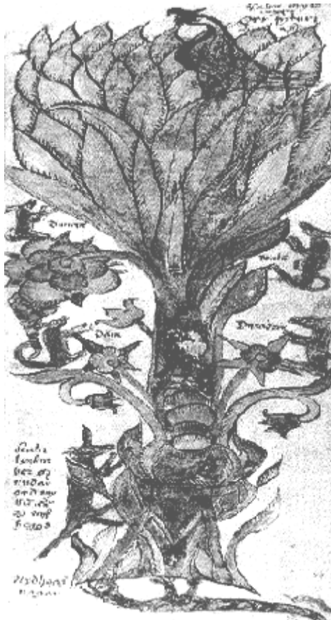
Abb. 5: Yggdrasil

Der Baum wird Yggdrasil 54 genannt und ist der Erzählung nach eine Esche. Er hat drei Wurzeln, die sich in drei verschiedene Richtungen ausbreiten: die erste nach Hel (Totenreich), die zweite in die Menschenwelt und die dritte ins Riesenreich. Am Fusse Yggdrasils befinden sich drei Quellen: die Quelle der Schicksalsgöttin Urd, der Mimirbrunn und Hvergelmir. Daran labt sich die Esche und ist deshalb immergrün. Wie auf der Abbildung 4 zu sehen ist, verbindet Asbru („Asenbrücke“) die Welt der Menschen mit dem Götterreich im Geäst Yggdrasils. Über diese Brücke gelangen die Götter zu den Menschen. Aber auch das Gegenteil ist möglich: Die Initiierten reisen auf ihr bei der Seelenexkursion, wie das früher die Schamanen taten 55 , und die gefallenen Helden gelangen so in ihre letzte Ruhestätte. In Yggdrasils Ästen sitzt ein Adler, an seinen Wurzeln nagen Schlangen 56 , namentlich Nidhögr, und das Eichhörnchen Ratatoskr läuft dem Stamm entlang zwischen den Schlangen und dem Adler hin und her, um Unfrieden zu stiften. Ausserdem fressen vier Hirsche die Blätter des Weltenbaumes. Diese Tiere sind auf der untenstehenden Abbildung (Abb. 5) zu erkennen. Durch sie ist Yggdrasil gefährdet. All diese Motive finden sich auch in den Mythologien anderer Völker. 57