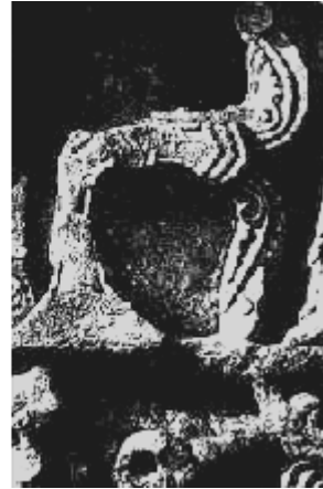
Abb. 7: Irminsul nach der Zerstörung durch Karl den Grossen (nach rechts geknickt)